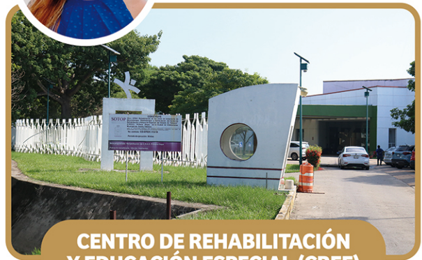
CENTRO DE REHABILITACIÓN Y EDUCACIÓN ESPECIAL (CREE)

CARLOS PELLICER CÁMARA 20, COL. CASA BLANCA 2DA SECCIÓN, 86060 Ext. 39 420