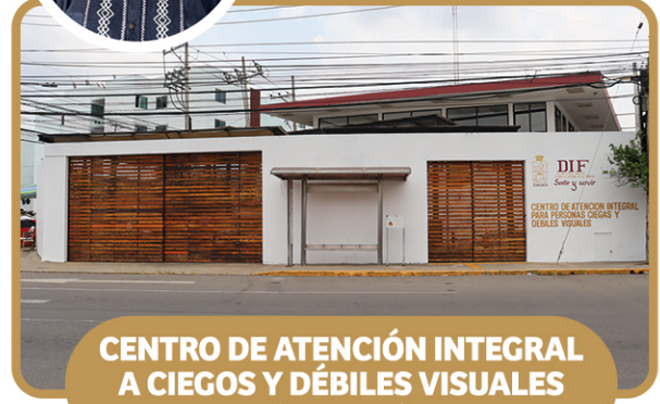
CENTRO DE ATENCIÓN INTEGRAL A CIEGOS Y DÉBILES VISUALES (CAICDV)

PROL. 27 DE FEBRERO, ESQ. EMILIANO CARRANZA S/N, COLONIA EL ESPEJO I Ext. 39 411