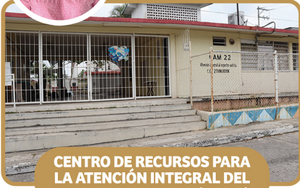
CENTRO DE RECURSOS PARA LA ATENCIÓN INTEGRAL DEL ESPECTRO AUTISMO (CRIAT)