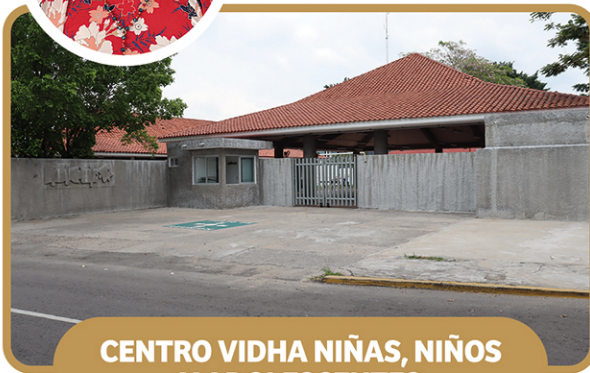
CENTRO VIDHA NIÑAS, NIÑOS Y ADOLESCENTES

PERIFÉRICO CARLOS PELLICER CÁMARA S/N, COL. EL ESPEJO II, C.P. 86109 Ext. 39 407