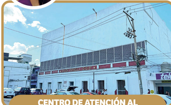
CENTRO DE ATENCIÓN AL ADOLESCENTE TABASQUEÑO (CAAT)

GREGORIO MÉNDEZ MAGAÑA NO. 2608, COL. ATASTA, C.P. 86100 Tel. 993-354-3680