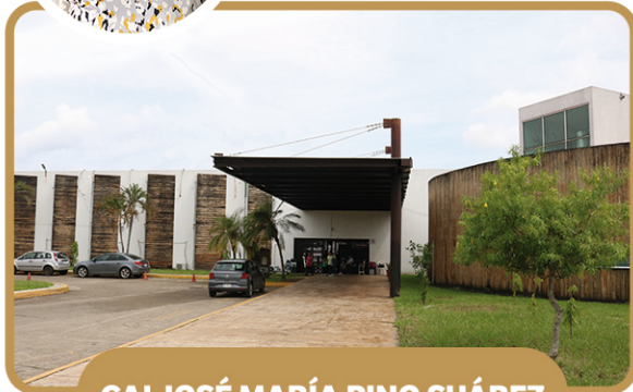
CAI JOSÉ MARÍA PINO SUÁREZ

PROLONGACIÓN AV. 27 DE FEBRERO C.P. 86108 S/N, COLONIA ESPEJO I Tel. 993-223-9199