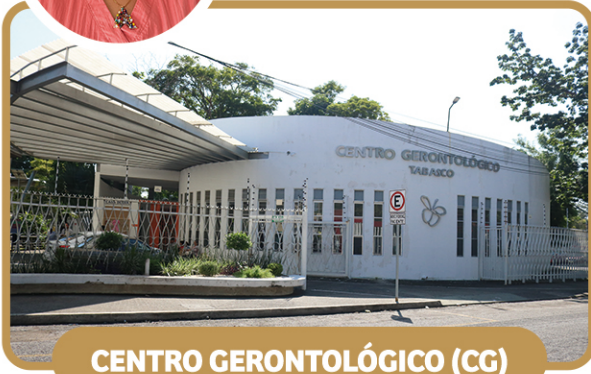
CENTRO GERONTOLÓGICO (CG)

RAMÓN MENDOZA 182, COL. EL RECREO, C.P. 86020 Ext. 39 691