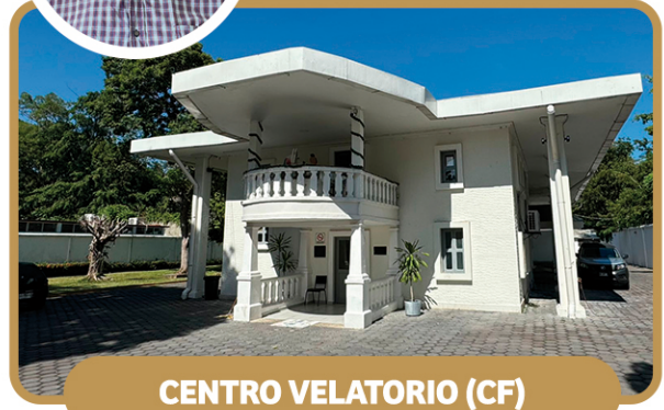
CENTRO VELATORIO (CF)

AV. 27 DE FEBRERO 1800, COL. ATASTA DE SERRA, C.P. 86100 Ext. 39 621