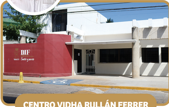
CENTRO VIDHA RULLÁN FERRER

ANTONIO RULLÁN FERRER 232, COL. MAYITO Tel. 914-133-2319