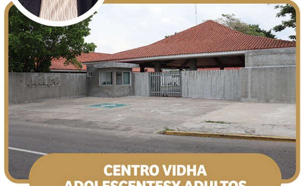
CENTRO VIDHA ADOLESCENTES Y ADULTOS

PERIFÉRICO CARLOS PELLICER CÁMARA S/N, COL. EL ESPEJO II, C.P. 86109 Ext. 39 411