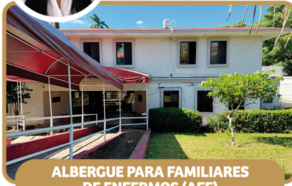
ALBERGUE PARA FAMILIARES DE ENFERMOS (AFE)

AV. GREGORIO MÉNDEZ MAGAÑA NO. 2846 COL. TAMULTÉ DE LAS BARRANCAS Ext. 39 615