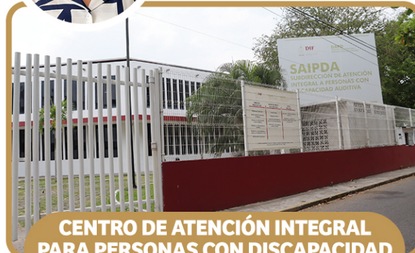
CENTRO DE ATENCIÓN INTEGRAL PARA PERSONAS CON DISCAPACIDAD AUDITIVA (SAIPDA)

RAMÓN MENDOZA NO. 182, COL. EL RECREO, C.P. 86020 Ext. 39 406