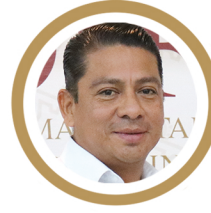
VÍCTOR DE DIOS GÓMEZ COORDINADOR GENERAL DEL SISTEMA DIF TABASCO