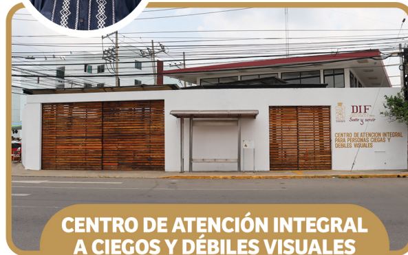
CENTRO DE ATENCIÓN INTEGRAL A CIEGOS Y DÉBILES VISUALES (CAICDV)

PROL. 27 DE FEBRERO, ESQ. EMILIANO CARRANZA S/N, COLONIA EL ESPEJO I Ext. 39 411