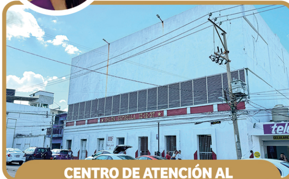
CENTRO DE ATENCIÓN AL ADOLESCENTE TABASQUEÑO (CAAT)

GREGORIO MÉNDEZ MAGAÑA NO. 2608, COL. ATASTA, C.P. 86100 Tel. 993-354-3680