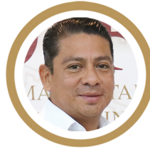
VÍCTOR DE DIOS GÓMEZ COORDINADOR GENERAL DEL SISTEMA DIF TABASCO