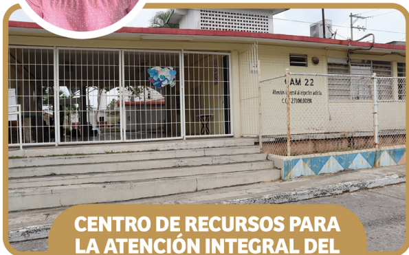
CENTRO DE RECURSOS PARA LA ATENCIÓN INTEGRAL DEL ESPECTRO AUTISMO (CRIAT)