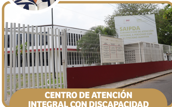
CENTRO DE ATENCIÓN INTEGRAL CON DISCAPACIDAD AUDITIVA (CAIDA)

RAMÓN MENDOZA NO. 182, COL. EL RECREO, C.P. 86020 Ext. 39 406